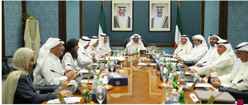
جانب من اجتماع مجلس الوزراء

عقد مجلس الوزراء اجتماعه الأسبوعي أمس الثلاثاء قصر بيان برئاسة سمو الشيخ أحمد عبدالله الأحمد الصباح رئيس مجلس الوزراء وبعد الاجتماع صرح نائب رئيس مجلس الوزراء وزير الدولة لشؤون مجلس الوزراء شريدة عبدالله العوشرجي بما يلي: استمع مجلس الوزراء في مستهل اجتماعه إلى شرح من وزير المالية وزير الدولة للشؤون الاقتصادية والاستثمار وزير النفط بالإنابة الدكتور أنور علي المضف حول إعلان الرئيس التنفيذي مؤسسة البترول الكويتية الشيخ نواف سعود ناصر الصباح وشركة نفط الكويت يوم الأحد الماضي عن اكتشاف كميات تجارية جديدة من النفط الخفيف والغاز المصاحب في حقل النوخدة البحري الذي يقع شرق جزيرة فيلكا مؤكداً أن هذا الاكتشاف يضع دولة الكويت على خريطة المنتجين الإقليميين الرائدتين في مجال النفط والغاز ويرفع من مكانة البلاد على المستوى العالمي معتبرا هذا الاكتشاف بأنه مشروع وطني يهدف إلى تعزيز احتياطيات دولة الكويت من الموارد الهيدروكربونية.