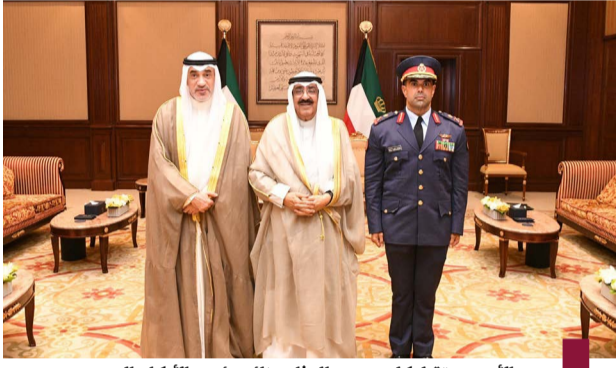
سمو الأمير مستقبلا كلا من وزير الدفاع ونائب رئيس الأركان الجديد

كونا - صدر مرسوم أميرى بتعيين اللواء الركن طيار صباح جابر الأحمد الصباح نائبا لرئيس الأركان العامة للجيش وفيما يلي نص المرسوم: «مرسوم رقم (١٢٠) لسنة ٢٠٢٤ بتعيين نائب رئيس الأركان العامة للجيش بعد الاطلاع على الدستور، وعلى الأمر الأميري الصادر بتاريخ ٢ ذو القعدة ١٤٤٥ هـ الموافق ١٠ مايو ٢٠٢٤، وعلى القانون رقم ٣٢ لسنة ١٩٦٧ في شأن الجيش والقوانين المعدلة له، وبناء على عرض النائب الأول لرئيس مجلس الوزراء ووزير الدفاع، وبعد موافقة مجلس الوزراء، رسما بالآتي مادة جابر الأحمد الصباح نائبا لرئيس الأركان العامة للجيش - ٢ - على النائب الأول لرئيس مجلس الوزراء ووزير الدفاع تنفيذ هذا المرسوم، ويعمل به من تاريخ صدوره. أمير الكويت مشعل الأحمد الجابر الصباح رئيس مجلس الوزراء أحمد عبدالله الصباح نائب رئيس الأركان العامة للجيش صباح جابر الأحمد الصباح جابر