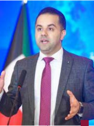
الدكتور عبدالله السند

الدفاع فهد يوسف سعود الصباح صدر بقصر السيف في: ٨ محرم ١٤٤٦ هـ الموافق: ١٤ يوليو ٢٠٢٤ م. واستقبل حضرة صاحب السمو أمير البلاد الشيخ مشعل الأحمد الجابر الصباح حفظه الله ورعاه بقصر بيان معالي النائب الأول لرئيس مجلس الوزراء وزير الدفاع ووزير الداخلية الشيخ فهد يوسف سعود الصباح حيث قدم لسموه حفظه الله نائب رئيس الأركان العامة للجيش اللواء ركن طيار الشيخ صباح جابر الأحمد الصباح وذلك بمناسبة تعيينه بمنصبه الجديد.