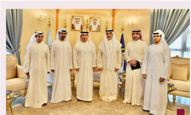
اليوسف خلال استقباله وفد الإنتربول

وزير الداخلية ووكيلها استقبال رئيس المنظمة الدولية للشرطة الجنائية