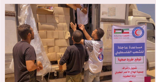
جانب من المساعدات الكويتية

استقبل النائب الأول لرئيس مجلس الوزراء ووزير الدفاع ووزير الداخلية الشيخ فهد يوسف سعود الصباح أمس رئيس المنظمة الدولية للشرطة الجنائية «الإنتربول» الدكتور أحمد ناصر الريسى، وفي بداية اللقاء رحب الفريق اللقاء رحب النائب الأول لرئيس مجلس الوزراء ووزير الدفاع ووزير الداخلية بضيفه، وتم مناقشة عدد من الموضوعات المشتركة. وأكد اليوسف دور دولة الكويت في التعاون مع المنظمات الدولية ودعمها بما يحقق الأمن والسلام وحفظ حقوق الإنسان، وجرى خلال اللقاء بحث سبل توسيع آفاق التعاون والتنسيق بين دولة الكويت والمنظمة في مجال الأمن وتبادل الخبرات ودعم التدريب. ومن جانبه أشاد عمالي الدكتور أحمد الريسى على كرم الاستقبال في دولة الكويت مثمناً جهود وزارة الداخلية في التعاون الدولي والحرص على الأمن والسلام العالي ومكافحة الجريمة المنظمة.