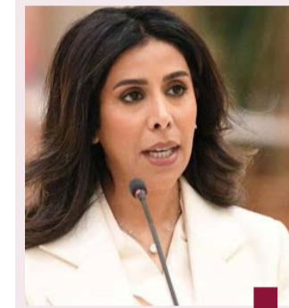
د. نورة المشعان

شكلت وزير الدولة لشؤون البلدية الدكتورة نورة المشعان فريق عمل متخصص في رصد التعديات والمخالفات على أملاك الدولة واتخاذ كافة الإجراءات لمعالجة تلك التعديات وإزالتها وفق النظم واللوائح في كافة مناطق الكويت. وفي أول اجتماع للفريق أعلن رئيس الفريق م.عبدالله جابر انطلاق الحملة وفق خطة عمل تبدأ من المناطق البرية بإزالة التعديات واتخاذ الإجراءات القانونية بشأنها.