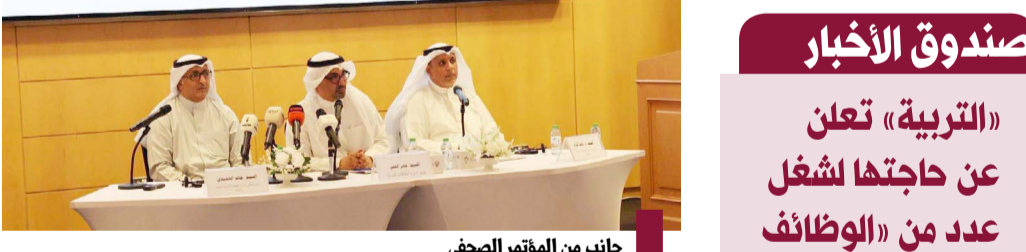
جانب من المؤتمر الصحفي

القوى العاملة أطلقت المشروع الوطني «معا 4»