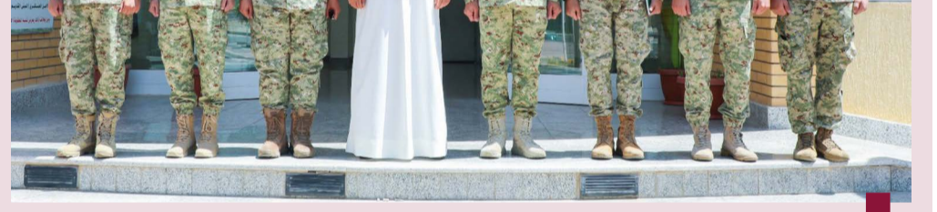
النواف خلال زيارة مديرية الأمن العسكري في معسكر الصمود

أصدر النائب الأول لرئيس مجلس الوزراء وزير الدفاع وزير الداخلية الشيخ فهد اليوسف قراراً وزارياً بتعديل المادة ٨ من القرار الوزاري رقم ٢٧١ لسنة ٢٠٢٠، لتنظيم أنشطة شركات نقل البضائع وتقديم الطلبات الاستهلاكية وتقديم الخدمات اللوجستية، وبقي وقف مبيئة أن اللقاء مع الوفد الحكومي الصيني الزائر تركز على بحث تفاصيل وآليات البدء في تنفيذ