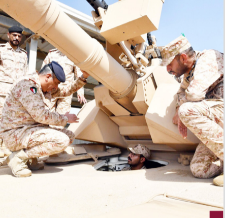
رئيس الأركان خلال جولته

قام رئيس الأركان العامة للجيش الفريق الركن طيار بندر سالم المزين بزيارة إلى لواء السور الألي/٢٦، حيث كان في استقباله أمر القوة البرية اللواء الركن همد عبد الله و أمر كتيبة المشاة الألية/٦٣ وعدد من ضباط اللواء. وقد استهلت الزيارة بتقديم شرح مفصل عن أهم الواجبات الخاصة بلواء السور الألي / ٢٦ إضافة إلى بيان طبيعة المهام التي يقوم بتنفيذها. كما قام رئيس الأركان بجولة شملت عدة مرافق داخل اللواء. كما تفقد المزين قيادة مجموعة صباح المشتركة حيث كان في استقباله أمر قيادة مجموعة صباح المشتركة وعدد من الضباط. وأكد رئيس الأركان حرص القيادة الحكيمة على متابعة شؤون وأوضاع