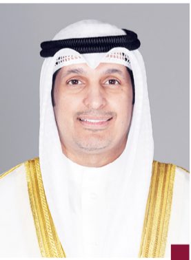
عبد الرحمن المطيري

القدم طبقاً للوائح ونظم المنظمات الدولية والقارية الرياضية. وفي ذات السياق أعلنت الهيئة أنه بمناسبة استضافة بطولة كأس الخليج العربي (٢٦) سيقدّم الوزير المطيري ويصنّفه رئيس اللجنة العليا المنظمة العليا للبطولة عرضاً مرئياً للجنة التنفيذية يتضمن الدليل الإجرائي لتنظيم البطولة وفقاً للمعايير العالمية.