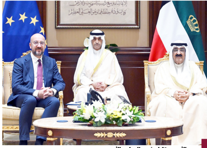
سمو الأمير يستقبل رئيس المجلس الأوروبي

قال رئيس المجلس الأوروبي شارل ميشيل إن الاتحاد الأوروبي مستعد لتعزيز التعاون مع الكويت في كافة المجالات. وأضاف ميشيل خلال تفريده عبر حساب بثته الاتحاد الأوروبي لدى الكويت بمنصة اكس أن هناك «مناقشات ممتازة مع صاحب السمو أمير دولة الكويت وسمو ولي العهد وسمو رئيس مجلس الوزراء تتعلق بسبل زيادة التجارة والاستثمارات بالإضافة إلى الجهود المشتركة لتحقيق السلام في المنطقة».