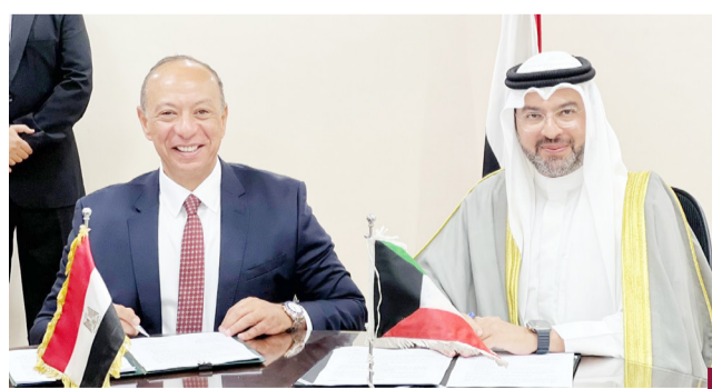
جانب من التوقيع على مذكرة التفاهم

اجراها وفهد برئاسته من الطيران المدني الكويتي مع المسؤولين المصريين في محطة الطيران المدني في القاهرة.