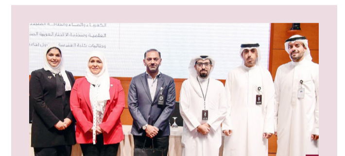
الشيخة تناصر الصباح مع المشاركين بالحلقة النقاشية

استقبل أمس الثلاثاء رئيس الوزراء المصري د.مصطفى مدبولي، وزير الخارجية عبد الله اليحيا بمناسبة زيارته الرسمية والوفد المرافق إلى العاصمة القاهرة. وقالت «الخارجية» في بيان، إن الوزير اليحيا نقل تحيات رئيس مجلس الوزراء سمو الشيخ أحمد العبدالله وتمنيات سموه لجمهورية مصر العربية وشعبها الشقيق مزيداً من التقدم والازدهار، فيما حمل رئيس مجلس الوزراء بجمهورية مصر العربية تحياته إلى دولة الكويت بقيادة وحكومة وشعباً وتمنياته لدولة الكويت وشعبها مزيداً من التطور والتمتع. كما تم خلال اللقاء بحث أوضاع العلاقات الأخوية الراسخة ومسارات التعاون المشترك وسبل تعزيزها في مختلف المجالات التي تخدم مصالح البلدين والشعبين الشقيقين واستعراض مستجدات الأوضاع في المنطقة ويحث عدد من القضايا الإقليمية والدولية