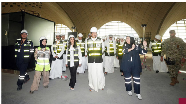
العبدة والوزراء خلال جولتهم التفقدية للمشروع

العبدة تفقد المشروع برفقة الوزراء ووجههم للتعاون مع الأشغال لتذليل المعوقات