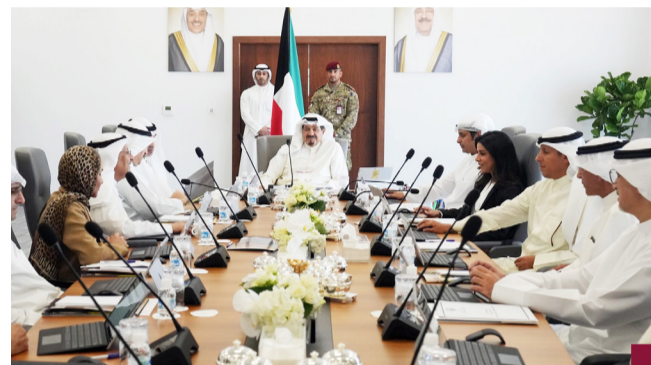
اجتماع مجلس الوزراء في أرض المطار الجديد

المجلس يعقد اجتماعه الأسبوعي في مبنى الركاب الجديد T2