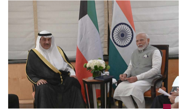
سمو ولي العهد مستقبلاً رئيس وزراء الهند

اللجنة الأولمبية الدولية توماس باخ وتم خلال اللقاء مناقشة سبل التعاون المشترك وتعزيز الروابط الرياضية المشتركة بالإضافة إلى دعم وتطوير اللجنة الأولمبية الكويتية بكافة المجالات بما يعود بالنفع على الرياضيين في دولة الكويت.