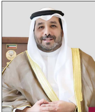
السفير الشيخ صباح ناصر صباح الأحمد

سفيرنا في السعودية يهنئ المملكة بذكرى اليوم الوطني صباح الناصر: الكويت والسعودية توأمان لا ينفصلان ويسيران في طريق المجد سوياً