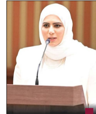
نورة الفصام وزيرة المالية

«التربية»: محاضرات توعوية لرفع الوعي الضريبي لدى الطلبة