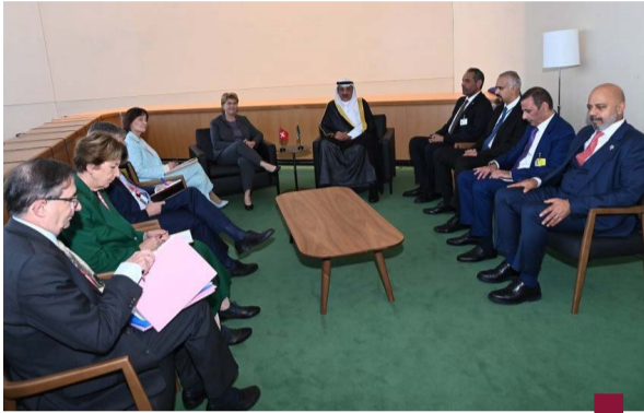
مستقبلاً رئيسة الاتحاد السويصري