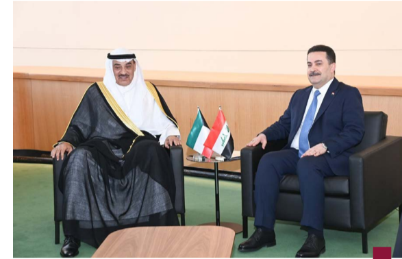
مستقبلاً رئيس وزراء العراق