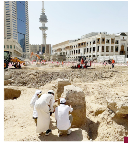
الاعمدة المكتشفة بسوق المباركية

الفجامة: تخصصات جديدة في «التطبيقي» لتلبية احتياجات سوق العمل