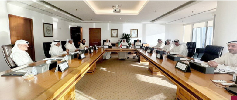
جانب من اجتماع مجلس الجامعات الحكومية الكويتي

اعتمد مجلس الجامعات الحكومية الكويتي أمس الاثنين مذكرة تعليق ووقف أنشطة الانتخابات الطلابية في جميع مراحل التعليم العالي بالجامعات والكليات الحكومية داخل دولة الكويت وخارجها والمؤسسات التعليمية الأخرى. وقالت الأمين العام لمجلس الجامعات الحكومية بالتكليف هبة الشطي في تصريح صحفي عقب الاجتماع الذي عقد اليوم برئاسة وزير التعليم العالي والبحث العلمي ووزير التربية بالوكالة الدكتور نادر الجلال وبحضور أعضاء المجلس أن المجلس ناقش في اجتماعه البنود المدرجة على جدول أعماله حيث صادق المجلس على القرارات الصادرة من مجلس الجامعات الحكومية. وأوضحت الشطي أن المجلس اعتمد في اجتماعه المذكورة بشأن تعليق