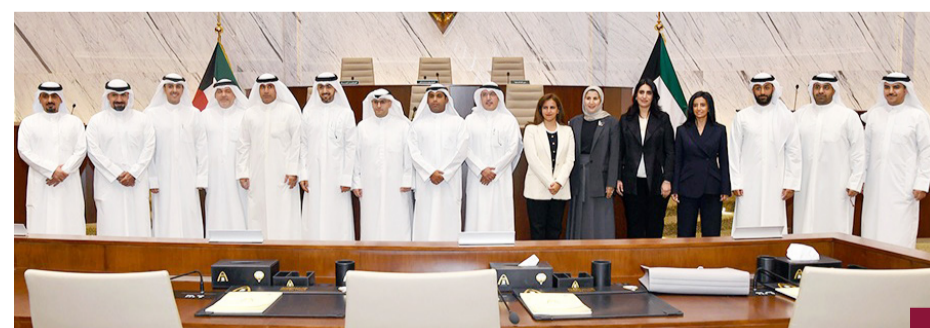
المشاري مع أعضاء المجلس البلدي

أكد وزير الدولة لشؤون البلدية ووزير الدولة لشؤون الإسكان عبداللطيف المشاري أن المجلس البلدي جزء لا يتجزأ من المنظومة العمرانية في البلاد معرباً عن تفاؤله بتعاون أعضاء البلدي البناء لخدمة البلاد. وقال الوزير المشاري في تصريح صحفي عقب لقائه رئيس وأعضاء المجلس البلدي أنه تم مناقشة عدد من الموضوعات والواجبات والاقتراحات التي تعود بالنفع للمجتمع بما يخدم النظرة العمرانية الشاملة للبلاد. وأضاف أنه تم أيضاً مناقشة موضوع الحدائق والمخلات والمخطط الهيكلي للبلدية معرباً عن تفاؤله بتحقيق الأهداف المرجوة من المجلس البلدي مشيراً إلى أن من أولوياته في البلدية العمل على رؤية معمارية واضحة للبلاد. وأضاف المشاري أن الوزير البلدي عبدالله المحري في تصريح مماثل إن زيارة الوزير المشاري للمجلس تدل على اهتمامه وحرصه للعمل والتعاون مع أعضاء البلدي لتسريع وتيرة المشاريع العمرانية والحضري في البلاد.