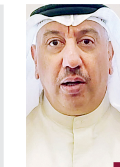
العميد محمد الوهيب

صدر مرسوم بتعديل المادة التاسعة من المرسوم رقم ٨١ لسنة ٢٠١٤ بشأن نظام المحافظات، بحيث يستبدل نصها بالنص الآتي: ينشأ في كل محافظة مجلس يسمى بمجلس المحافظة يقوم بمعاونة المحافظ في مباشرة اختصاصاته. ويصدر بتشكيله قرار من مجلس الوزراء برئاسة المحافظ وعضوية كل من نائب المحافظ وممثلين عن الجهات الحكومية التي يحددها مجلس المحافظة. مجلس الوزراء ويرشحهم الوزير المختص التابعين له بالتنسيق مع المحافظ على ألا تقل درجة كل منهم عن مدير إدارة، ٣ من المواطنين المقيمين في المحافظة يرشحهم المحافظ. ويجوز للمحافظ دعوة من يراه مناسباً لحضور اجتماعات المجلس للاستعانة به في أعماله، وتصدر بقرار من المحافظ لائحة لتنظيم اجتماعات وأعمال وقرارات مجلس المحافظة.