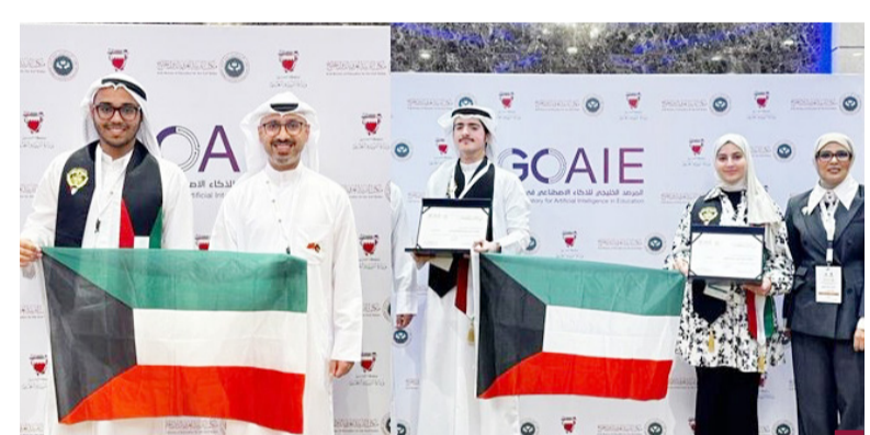
تكريم الطلاب الكويتيين في مسابقة الماكاثون الخليجي بالبحرين