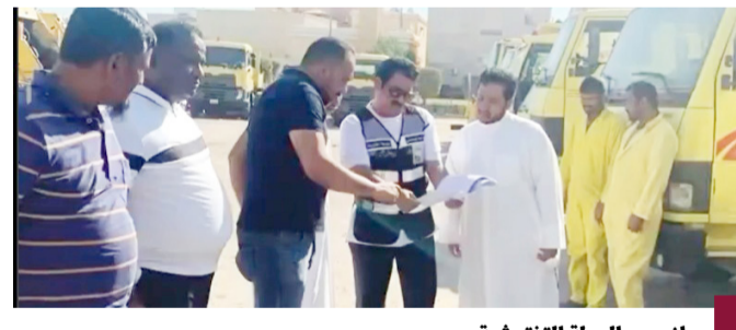
جانب من الجولة التفتيشية

أعلنت بلدية مبارك الكبير عن استمرارها في تنفيذ جولات تفتيشية دورية للكشف على المعدات والآليات والسيارات المستخدمة في عقد مراكز النظافة في مناطق القرين ومبارك الكبير وصبحان. تأتي هذه الجولات في إطار الحرص على التأكد من جاهزية المعدات وكفاءة آلية عملها وانتشارها في المناطق المستهدفة. تشمل هذه الجولات فحص الآليات لضمان سلامتها وكفاءتها في أداء المهام المطلوبة، وتهدف الإجراءات إلى تحسين جودة الخدمات المقدمة والمحافظة على نظافة المناطق بشكل دوري ومستمر.