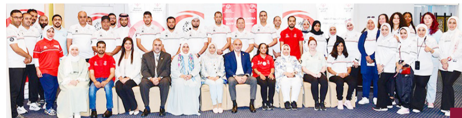
جانب من الدورة التدريبية الإقليمية

في السباحة. وأضافت أن الدورة ستساهم في تأهيل المزيد من الكوادر التدريبية لاسيما تطوير القدرات الهادفة لترجمة أهداف «الأولمبياد الخاص» وتعزيز مكانته كأكبر حدث رياضي