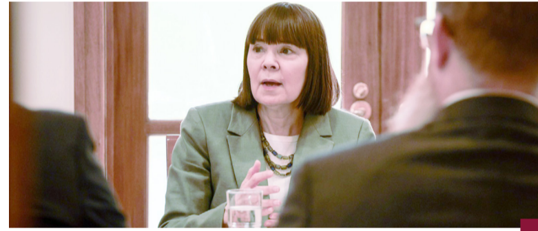
السفيرة الأميركية خلال اللقاء مع ممثلي الصحف المحلية

أعربت سفيرة الولايات المتحدة لدى البلاد كارين ساساهارا عن التطلع لبناء مجالات تعاون جديدة قائمة على «العلاقات القوية» مع دولة الكويت ودراسة مشروعات وفرص للتعاون في مجالات متعددة ومختلفة لاسيما في مجال الأمن السيبراني والذكاء الاصطناعي. جاء ذلك في تصريحات أدلت بها السفيرة ساساهارا خلال مناقشات مائدة مستديرة نظمها السفارة الأمريكية لدى البلاد بحضور (كونا) وممثلي عدد من وسائل الإعلام الأخرى.