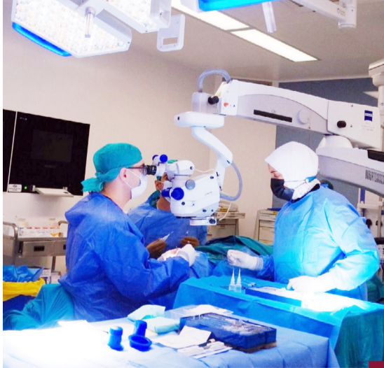
إجراء أحدث جراحات علاج الماء الأزرق جلوبوكوما في الفروانية

أعلنت وزارة الصحة أنها ستستضيف في مستشفياتها ومراكزها الصحية ١٣ طبيباً عالمياً، وذلك ضمن برنامج الأطباء الزائرين خلال شهر سبتمبر. وذكرت أنه يمكن التعرف على قائمة الأطباء الزائرين وحجز موعد مسبق من خلال تطبيق «كويت - صحة» وتطبيق سهل. من ناحية أخرى قالت وزارة الصحة إنه تم إجراء واحدة من أحدث جراحات علاج الماء الأزرق جلوبوكوما في مستشفى الفروانية عن طريق زراعة أحدث جهاز التحكم في ضغط العين EyeWatch System. وأوضحت الصحة أن الجهاز يعد واحداً من أحدث التقنيات العالمية المستخدمة لعلاج الجلوكوما. كما يمنح الأطباء قدرة غير مسبوقة على التحكم في ضغط العين بدقة. وأضافت الوزارة أن نحو ٩٠٪ من المرضى قلت حاجتهم للقطرات و٤٠٪ استغنوا عنها بعد الجراحة.