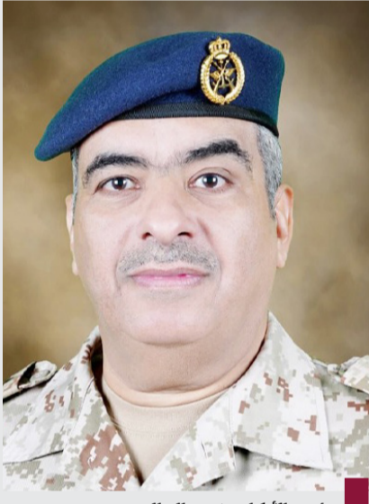
رئيس الأركان بندر سالم المزين

تفقد رئيس الأركان العامة للجيش الفريق الركن طيار بندر سالم المزين أمس السبت، عدد من الوحدات والمواقع العسكرية. وأكد المزين خلال زيارته التفقدية للوحدات والمواقع العسكرية على ضرورة المحافظة على أعلى درجات الاستعداد القتالي واليقظة العالية، وأعرب عن تقديره للجهود المبذولة من قبل منتسبي مختلف وحدات الجيش، وأشاد بمستوى الجاهزية والعمل الجاد للحفاظ على أمن وسلامة الوطن.