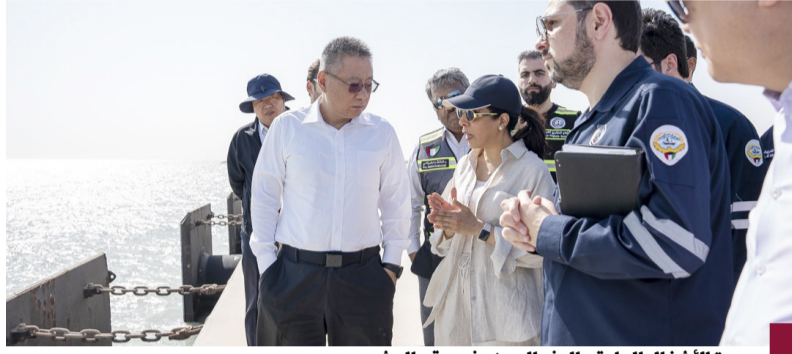
وزيرة الأشغال العامة والوفد الصيني في موقع المشروع

أكد خلال الزيارة الميدانية حرصه على تسريع عجلة التنفيذ لإنشاء وتطوير ميناء مبارك الكبير الذي سيسهم في خلق ممر إقليمي آمن ومركز للتجارة في المنطقة وعلى جدية الشركات الصينية الحكومية في تنفيذ مراحل المشروع وربطه بمبادرة (الحزام والطريق) والذي له آثار إيجابية تنعكس على الأصعدة الاقتصادية والتنموية للكويت والدول المجاورة. ولفتت إلى استمرارية المحادثات مع الجانب الصيني الحكومي بشأن مواعيد