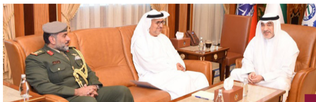
وزير الداخلية يستقبل السفير الإماراتي

دولة الإمارات العربية المتحدة الشقيقة. بدوره أكد السفير الإماراتي وفق البيان على أهمية ما تم بحثه من موضوعات تؤدي إلى