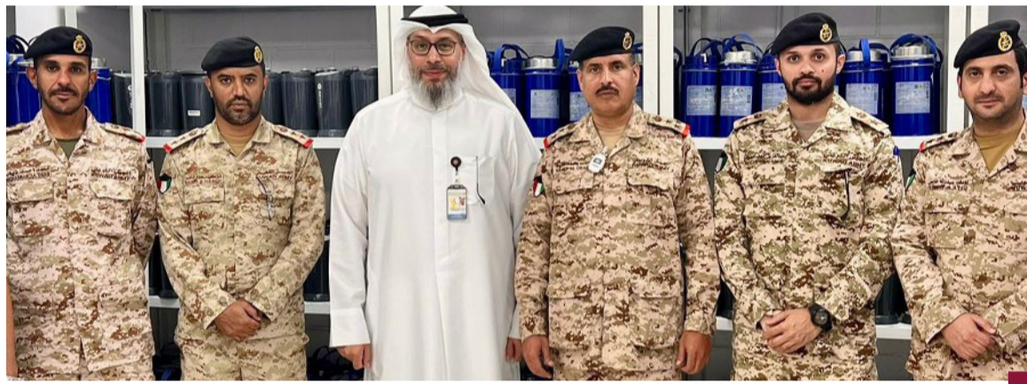
وفد الدفاع في زيارته للمخزن المركزي للنفايات المشعة بوزارة الصحة

وأشارت إلى أنه بادرت حينها مباشرة باتخاذ جميع الإجراءات اللازمة، لضمان استمرار تقديم الخدمات الصحية الأساسية والحيوية في مراكز الرعاية الصحية الأولية «المستوصفات» والمستشفيات العامة والمراكز التخصصية والمنشآت الصحية، والعمل بالمستندات المطبوعة المعدة مسبقاً، والحفاظ على سلامة البيانات. وأكدت «الصحة» أنها اتخذت على الفور العديد من الإجراءات أثناء ذلك، ومنها: التنسيق مع الجهات الحكومية الأمنية المختصة، مما ساهم في احتواء المشكلة ومنع انتشارها، وفصل الأنظمة المصابة عن الشبكة بشكل فوري لمنع الانتشار إلى المزيد من الأجهزة والأنظمة، وتعزيز إجراءات الحماية بتحديث البرمجيات، وتطبيق