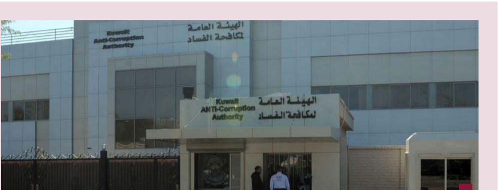
مبنى مكافحة الفساد