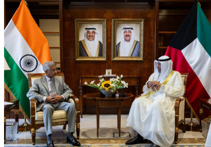
وزير الخارجية مستقبلا نظيره الهندي

لتوسيع التعاون في مجال الأدوية والمعدات الطبية لافتتاحها إلى أن الاعتراف بدستور الأدوية الهندي من شأنه أن يساعد في هذا المجال. وحول العلاقة المستقبلية مع دول مجلس التعاون الخليجي قال الوزير جايشانكر إن بلاده تعتبر مجلس التعاون الخليجي شريكا رئيسيا للهند موضحا أن «منطقة الخليج قريبة جدا وذات مصالح اقتصادية وأمنية وسياسية كبرى وندرك تماما أن مجلس التعاون يمثل سدس إجمالي تجارة الهند وثالث إجمالي تواجد جالياتها».