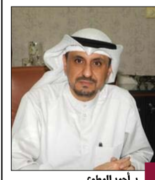
د. أحمد المطوع

تفشي مرض جدري القروء في بعض المناطق حول العالم. وأكد أن الوزارة تعمل على اتخاذ كل الإجراءات اللازمة لحماية صحة المواطنين والمقيمين في الكويت، وتوفير الدعم اللازم لفرق العمل في المركز لضمان مواجهة الكفاءة والجاهزية في استمرارية المستجبات. من جانبه أشار الحساوي إلى أن فرق الترصد والتربص في إطار مواجهة التحديات الصحية الراهنة. العالمي، وتتواصل بشكل مستمر مع المنظمات الصحية الدولية لمواجهة أي تطورات جديدة قد تؤثر على الوضع الصحي في الكويت.