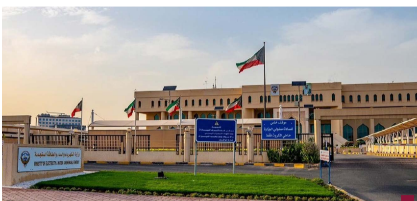
وزارة الكهرباء والماء

وأكدت الهيئة العامة للصناعة الأحد أهمية زيادة التنسيق المشترك مع الجهات المعنية لتمكينها من عمل الصيانة الشاملة لجميع المعدات وفق الجداول الزمنية لضمان استمرارية تدفق مياه التبريد إلى الجهات المستفيدة دون انقطاع. وأوضحت الهيئة في بيان صحفي أن مضخات مياه التبريد في المحطة الشمالية بمنطقة الشعبية الصناعية توقفت يوم أمس السبت في تمام الساعة ٦:٥٧ صباحا ما أدى إلى انقطاع مياه التبريد عن مصنع إسالة الغاز ومصفاة ميناء الأحمدية. وذكرت أنها تمكنت من إعادة تشغيل مضخات مياه التبريد عند الساعة ٧:٤٤ صباحا وفقا لخطة الطوارئ المتبعة لتعود العمليات التشغيلية إلى الوضع الطبيعي.