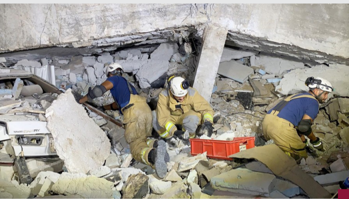
موقع انهيار عمارة الجابرية

في (الإطفاء) في بيان (كونا) إن فرقها توجهت إلى موقع الحادث فور ورود بلاغ بوقوعه بحضور رئيس القوة بالتكليف اللواء خالد عبدالله.