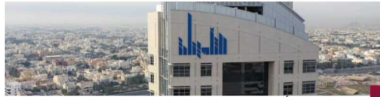
المؤسسة العامة للتأمينات الاجتماعية

أكدت أن سن التقاعد المعمول به 50 سنة للمرأة و55 للرجل