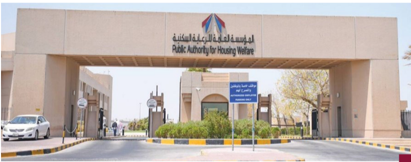
المؤسسة العامة للإعانة السكنية