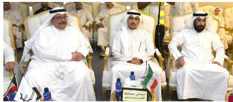
محافظ الأحمد خلال الزيارة

وقال الشيخ حمود الصباح إن (الشدايية الصناعية) مشروع حيوي ضمن رؤية (كويت جديدة ٢٠٣٥) التي تحظى باهتمام كبير ومتابعة مباشرة من القيادة السياسية مشيراً إلى أن التوجيهات السامية كانت واضحة