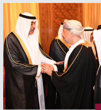
وسموه يستقبل الوفد العماني