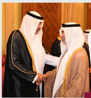
وسموه يستقبل الوفد الاماراتي