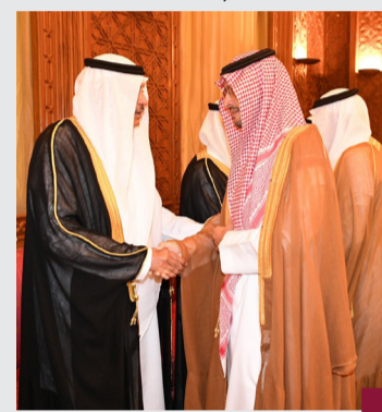
سمو ولي العهد يستقبل الوفد السعودي