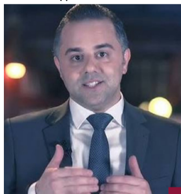
د. عبدالله السند

في الدول التي لا يغطيها ولا يتوفر بها مكتب صحي مما يضمن توفير خدمات طبية قائمة على الحوكمة المنضبطة. ويذكر المتحدث الرسمي باسم وزارة الصحة الدكتور عبدالله السند المخاوف في شأن ما يتردد من بين فترة وأخرى عن ظهور فيروسات جديدة أو متحورات بشكل يصور وكأن العالم على شفا حضرة من الهاوية. وأكد خلال برنامج «مفاهيم» الذي يبث على تلفزيون الكويت أن التحذيرات التي تصدر عن بعض المؤسسات العالمية المعنية برصد الأوبئة، هي مظهرها ما هي إلا دعوات للمختصين وللأنظمة الصحية ليكون العالم أكثر استعداداً لمواجهة أي وباء محتمل.