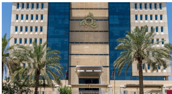
ديوان الخدمة المدنية

الخدمة المدنية رقم (٤١) لسنة (٢٠٠٦) بشأن قواعد وأحكام وضوابط العمل الرسمي. وأشار إلى أنه حرصاً من ديوان الخدمة المدنية على استكمال تنفيذ القرار بما في ذلك تحديد تاريخ البدء العملي للتنفيذ ووضع الآلية المتبعة لتنفيذه التي تشمل