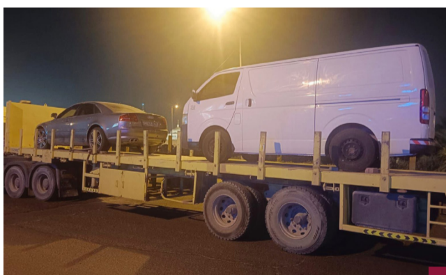
جانب من الجولات التفتيشية