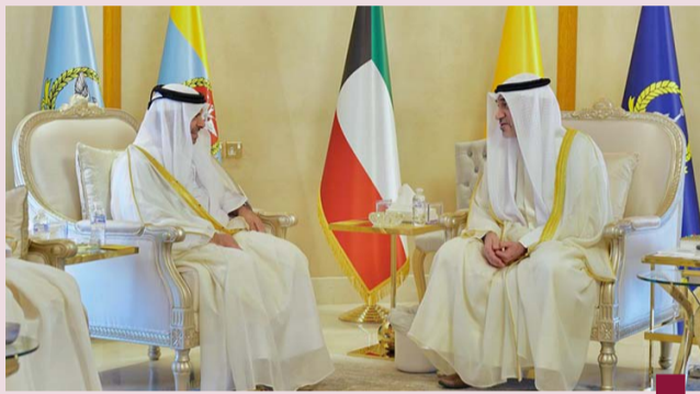
اليوسف مستقبلا أحد السفراء

بحث النائب الأول لرئيس مجلس الوزراء ووزير الدفاع وزير الداخلية الشيخ فهد يوسف سعود الصباح مع كل من سفراء قطر وتونس والتشيك واليمن سبل تعزيز التعاون والعمل الجماعي المشترك بين دولة الكويت والدول الشقيقة والصديقة. وقالت رئاسة الأركان العامة للجيش في بيان صحفي انه تم خلال اللقاءات تبادل وجهات النظر حول العديد من القضايا والموضوعات محل الاهتمام المتبادل إضافة إلى بحث سبل تعزيز التعاون والعمل الجماعي المشترك بين دولة الكويت والدول