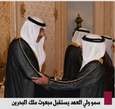
سمو ولي العهد يستقبل مبعوث ملك البحرين

استقبل سمو ولي العهد صباح صباح الخالد وأصحاب السمو الشيخوخة وسمو رئيس مجلس الوزراء الشيخ أحمد عبدالله وأسرة آل الصباح الكرام في قصر الشعب أمس الأربعاء مبعوث ملك البحرين الملك حمد بن عيسى وولي عهد البحرين الأمير سلمان بن حمد، الشيخ علي بن خليفة بن سلمان مستشار ولي العهد البحريني والوفد المرافق، حيث قاموا بتقديم واجب العزاء بوفاة المغفور له بإذن الله الشيخ علي عبدالله السالم المبارك الصباح.