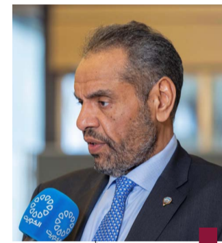
وزير الخارجية عبدالله الجحيا

العامة للأمم المتحدة. وقال الجحيا ان «حضورنا يأتي حرصا من دولة الكويت على المشاركة في احتفالية مرور ٧٥ عاما على تأسيس الناتو وذلك لتلبية لدعوة من فخامة الرئيس جو بايدن رئيس الولايات المتحدة الأمريكية». وأضاف أنه سينقل للرئيس الأمريكي خلال الاحتفالية تحيات القيادة السياسية في دولة الكويت وعلى رأسها حضرة صاحب السمو أمير البلاد الشيخ مشعل الأحمد الجابر الصباح حفظه الله ورعاه وسمو ولي العهد الشيخ صباح خالد الحمد الصباح حفظه الله وسمو رئيس مجلس