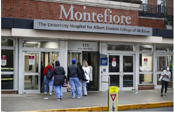
يعد مركزا رئيسيا لزراعة الأعضاء وجراحة السرطان والقلب وخصص جناحين لكوييتيين فقط

قالت المؤسسة العامة للرعاية السكنية إن مشروع البنية التحتية لجنوب سعد العبدالله يستغرق ٤ سنوات، وتبلغ مساحته ٦٤ كيلو متر مربع بعدد ٢٣ ألف و٥٥٠ قسيمة. وافتتحت إلى أن الفترة الزمنية المحددة لإنجاز أعمال عقد البنية التحتية للمدينة تنتهي في ٢١ نوفمبر ٢٠٢٧، حيث سيجري تنفيذ المشروع على ٦ مكونات رئيسية بدءا من أعمال البنية التحتية للطرق الرئيسية والمناطق الاستعمارية وخرانات مياه الأمطار وإيلاء المعالجة.