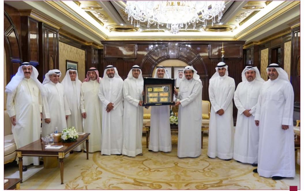
سمو رئيس الوزراء يستقبل رؤساء البنوك الكويتية

استقبل سمو الشيخ أحمد عبدالله أحمد الصباح رئيس مجلس الوزراء في قصر بيان رؤساء وممثلي مجالس إدارات البنوك الكويتية والأمين العام لاتحاد مصارف الكويت. وجرى خلال اللقاء مناقشة آليات تمكين القطاع المصرفي في دفع عجلة الاقتصاد الوطني والمساهمة الفعالة بخطط ومشاريع البلاد التنموية ورويتها الطموحة. حضر المقابلة معالي رئيس ديوان رئيس مجلس الوزراء عبدالعزيز دخيل الدخيل.