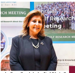
السفيرة الشيخة جواهر ابراهيم الدعيج الصباح

استعرضت مساعد وزير الخارجية لشؤون حقوق الإنسان السفيرة الشيخة جواهر ابراهيم الدعيج الصباح أمام ملتقى سنوي في كمبودج المحاور الرئيسية لسياسة دولة الكويت الخارجية. وقالت الشيخة في الملتقى السنوي الـ١٤ الذي انطلق في جامعة (كمبودج) الذي استمر أعماله حتى اليوم ١١ الجاري إن مداخلتها في الحلقة النقاشية بالملتقى استعرضت المحاور الرئيسية لسياسة الكويت الخارجية التي تستند إلى الصداقة والسلام