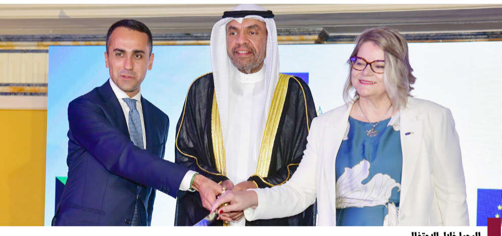
اليحيا خلال الاحتفال

وقالت رئاسة الأركان العامة إن التمرين يهدف لرفع مستوى التعاون والتنسيق بين قوة واجب صباح والإدارة العامة لخفر السواحل وتعزيز مفهوم العمل المشترك. حضر التمرين الوكيل المساعد لقطاع أمن الحدود بوزارة الداخلية اللواء مجبل فهد بن شوق ومدير عام الإدارة العامة لخفر السواحل العميد ركن بحري مبارك علي يوسف. نفذت القوة البرية متمثلة بقوة واجب صباح المشتركة، ووزارة الداخلية متمثلة بالإدارة العامة لخفر السواحل صباح أمس الأربعاء العرض النهائي لتمرين «الرقعة» المشترك بالذخيرة الحية، والذي عقد خلال الفترة من ١ ولغاية ٣ يوليو ٢٠٢٤. حيث تضمن التمرين تنفيذ عملية صد وشل لحركة المتسللين داخل المياه الإقليمية، وذلك برعاية وحضور أمر القوة البرية اللواء الركن خالد علي زايد.