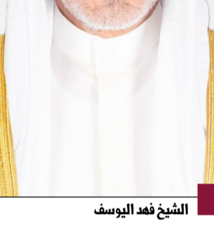
الشيخ فهد اليوسف

أمر النائب الأول لرئيس مجلس الوزراء ووزير الدفاع ووزير الداخلية الشيخ فهد اليوسف الصباح بتشكيل لجنة تحقيق خاصة للوقوف على ظروف واقعة وفاة أحد نزلاء المؤسسات الإصلاحية. وتقدمت وزارة الداخلية بأمر التحايز والمواساة إلى أسرة الفقيد، داعية الله أن يتغمده بواسع رحمته، ويلهم أهله الصبر والسلوان. وضمن الجهود الأمنية المكثفة لضبط مخالفين قانون الإقامة ممن لم يستفيدوا من المهلة، قامت الإدارة العامة لمباحث شؤون الإقامة بحملة أمنية تفتيشية على مختلف مناطق البلاد، وأسفرت الحملة عن ضبط عدد من مخالفين قانون الإقامة وتمت إحالتهم إلى جهة الاختصاص لاتخاذ الإجراءات القانونية اللازمة وإبعادهم عن البلاد.