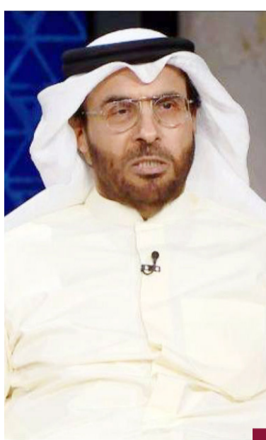
وزير المالية د. أنور علي المصنف

بمشروع الشقيا واتفاقية أخرى للمدن الاسكانية والمنطقة الشمالية. وأشار إلى أهمية دعم القطاع الخاص وفتح آفاق للتجارة إلى جانب توسيع نطاق الأدوات المالية. ولفت إلى أن هناك ٣ أدوات تكاملية للإصلاح الاقتصادي هي تنمية التجارة وتعزيز السياحة والصناعة المالية. ونوه إلى أن هناك مشروع جاهز لرفع سرعة الانترنت وتحسين طفرة في الاتصالات في الكويت. وأكد وزير المالية وجوب إعادة تسعير الأراضي وأملاك دولة لتحقيق استعادة أكبر منها ولكن ليس كما يفعل القطاع الخاص. وتابع أن الرواتب والدعم يمثلان أكبر بتديين في المصروفات لم يتغيروا في ميزانية السنة الحالية ويزاين تقريبا الدخل من النفط. وقال «قادرون على تنفيذ المشاريع وخطتنا للإصلاح الاقتصادي والمالي في البلد، والحفاظ على صندوق الاحتياطي الأجيال القادمة هدف رئيسي للكويت». وأوضح المصنف أن تحقيق الاستدامة والرفاه ضمان لاستمرار الإيرادات بشكل أفضل مشيراً إلى أن استمرار العجزات الحالية قد يدفعنا إلى تسيل الأصول أو الاقتراض. وزعمنا برامج لإيقاف الهدر في وزارات الدولة.. وسنراجع العقود ونعمل على تخفيضها نتوقع وصول العجز في ال 4 سنوات المقبلة إلى 26 مليار وإذا استمرت العجزات سنلجأ للتمويل من الاحتياطي مؤلنا من «لحمنا الحي» 33 مليار دينار للعجزات بالميزانية خلال الـ 10 سنوات الماضية