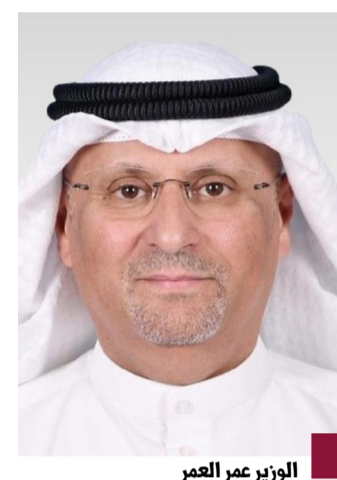
الوزير عمر العمر

القرار على أصحاب التراخيص الإفصاح عن رقم الترخيص في الحسابات المخصصة لمزاولة النشاط على المواقع الإلكترونية ومنصات التواصل الاجتماعي الخاصة بالشركة، وأن تتم جميع التعاملات التجارية للشركات عبر وسائل الدفع الإلكتروني فقط. كما وضع القرار الجديد عدد من الضوابط لعملية صرف دعم العمالة الوطنية، تضمنت تقديم كشف حساب بنكي خاص بالشركة المرخصة، وميزانية سنوية، وذكر حسابات المنصات الإلكترونية ومنصات وسائل التواصل الاجتماعي الخاصة بالشركة المرخصة، بالإضافة إلى أي مستندات أخرى يحددها الوزير أو من يفوضه، على أن يبدأ احتساب السنة الأولى من تاريخ صدور الترخيص.