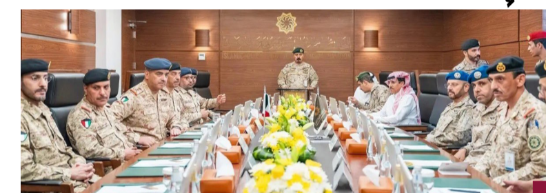
جانب من الزيارة

الاسلامي العسكري) في الرياض بما يقدمه التحالف لخدمة الدول الأعضاء والجهود التنسيقية المبذولة في هذا الشأن. من جانبه أشاد الأمين العام للتحالف الإسلامي العسكري لمحاربة الإرهاب اللواء الطيار الركن محمد الغديدي بما تقوم به دولة الكويت في حريها ضد الإرهاب وكل ما من شأنه أن يمس أمنها واستقرارها وعضويتها في العديد من المنظمات والمراكز الإقليمية والدولية المعنية بمحاربة الإرهاب ونبذ العنف والتطرف.