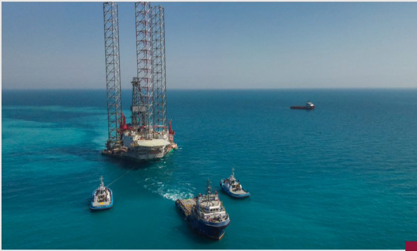
منصة الحفر (أورينتال فينيكس)