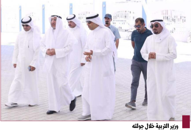
وزير التربية خلال جولته

الدفاع ووزير الداخلية الشيخ فهد يوسف سعود الصباح لمنسبي المركز داعياً إياهم إلى ضرورة التنسيق مع القطاعات العسكرية المختلفة من الجيش والحرس الوطني وقوة الإطفاء العام من خلال اجتماعات دورية. وقام الوكيل بالاطلاع على