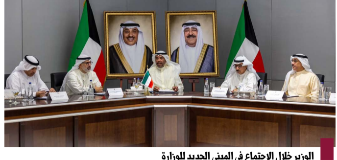
الوزير خلال الاجتماع في المبنى الجديد للوزارة

كونا - في وقت تعاني المنظومة الصحية بقطاع غزة انهياراً بسبب العدوان الإسرائيلي على القطاع للشهر التاسع على التوالي تمكنت إدارة مستشفى الكويت التخصصي من افتتاح مستشفى ميداني بمنطقة (المواصي) غرب مدينة (خان يونس) جنوب القطاع بعد استهداف جيش الاحتلال المقر الرئيسي في مدينة (رفح) واستهداف اثنين من العاملين فيه. ويعتبر المستشفى الميداني الكويتي الضابط على ٦ دولتمات من أهم