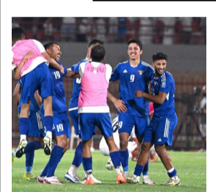
الفرقة توقع مع 4 منتخبات عربية في تصفيات كأس العالم

البلدية: رفع 14 سيارة مهمة وسكراب في الجهراء