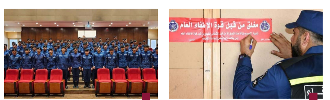
إغلاق منشأة مخالفة

والتقدم الحزفي في مختلف المراحل، بالإضافة إلى التحديات التي تم التغلب عليها لضمان سير العمل وفقاً للجدول الزمني. تلا ذلك جولة ميدانية في أرجاء المشروع، حيث أطلع رئيس الأركان