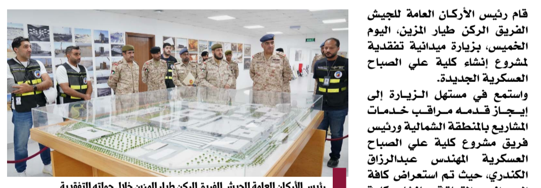
رئيس الأركان العامة للجيش الفريق الركن طيار المزين خلال جولته التفقدية

قام رئيس الأركان العامة للجيش الفريق الركن طيار المزين، اليوم الخميس، بزيارة ميدانية تفقدية لمشروع إنشاء كلية علي الصباح العسكرية الجديدة.