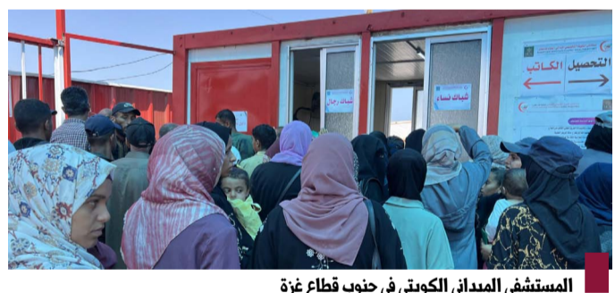
المستشفى الميداني الكويتي في جنوب قطاع غزة

كونا - في وقت تعاني المنظومة الصحية بقطاع غزة انهياراً بسبب العدوان الإسرائيلي على القطاع للشهر التاسع على التوالي تمكنت إدارة مستشفى الكويت التخصصي من افتتاح مستشفى ميداني بمنطقة (المواصي) غرب مدينة (خان يونس) جنوب القطاع بعد استهداف جيش الاحتلال المقر الرئيسي في مدينة (رفح) واستهداف اثنين من العاملين فيه. ويعتبر المستشفى الميداني الكويتي الضابط على ٦ دولتمات من أهم