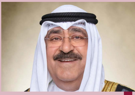
سمو الأمير الشيخ مشعل الأحمد