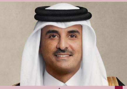
سمو الشيخ تميم بن حمد أمير قطر