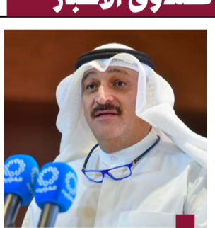
الوزير أحمد العوضي