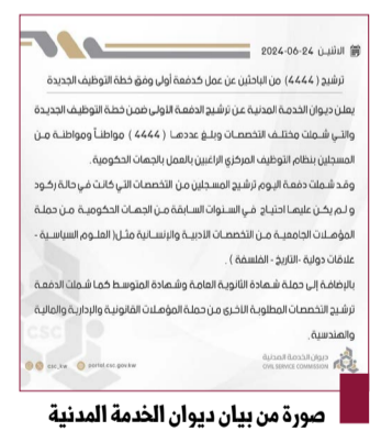
صورة من بيان ديوان الخدمة المدنية

أعلن ديوان الخدمة المدنية الأولى الاثنين ترشيح الدفعة الأولى ضمن خطة التوظيف الجديدة والتي شملت مختلف التخصصات وبلغ عددها ٤٤٤٤ مواطنا ومواطنة من المسجلين بنظام التوظيف المركزي الراغبين بالعمل بالجهات الحكومية.