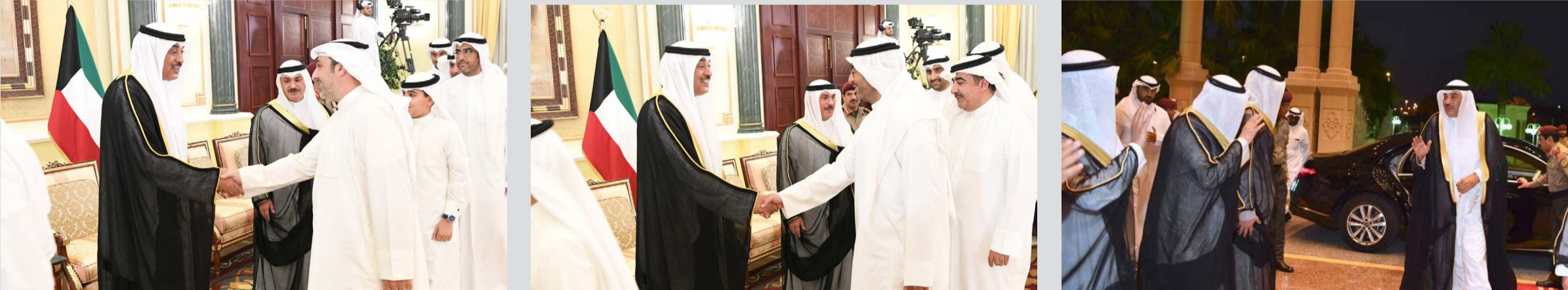
سمو ولي العهد مستقبلا جموع من المواطنين في قصر بيان

استقبل سمو ولي العهد الشيخ صباح الخالد، مساء اليوم الاثنين، جموعا من المواطنين الكرام وذلك في ديوان أسرة آل الصباح بقصر بيان، في أجواء تفيض بالمودة والمحبة. وقد جسّد هذا الاستقبال روح الأسرة الواحدة في المجتمع الكويتي الذي جبل على التلاحم والتواصل الأخوي قيادة وشعبا.