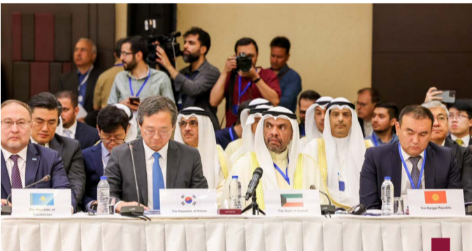
الوزير يجتمع مع وفد الكويت

قررت الهيئة العامة للتعليم التطبيقي والتدريب العودة للدراسة حضوريا في القاعات الدراسية بكليات ومعاهد الهيئة ابتداء من الغد ٢٥/٦/٢٠٢٤ وحتى نهاية الفصل الصيفي للعام الدراسي ٢٠٢٣/٢٠٢٤. بعدما كانت انتقلت اليوم إلى التعليم عن بعد ترشيحا لاستهلاك الكهرباء. وأكدت الهيئة أن القرار جاء بعد الاستماع إلى آراء أعضاء هيئة التدريس والتدريب في الهيئة حول التعليم عن بعد في الفصل الصيفي ومواجهة بعض المشاكل التقنية خاصة بعد تجربة اليوم الأول التي قد يكون من الصعب تلافيها بسبب قصر الفصل الصيفي وحرصا على مصلحة الطلبة. وأوضحت أنه تم التنسيق مع وزارة الكهرباء والماء والطاقة المتجددة التي أفادت بإمكانية العودة إلى النظام الحضوري مع التوصية بتقليل استهلاك الأحمال الكهربائية.